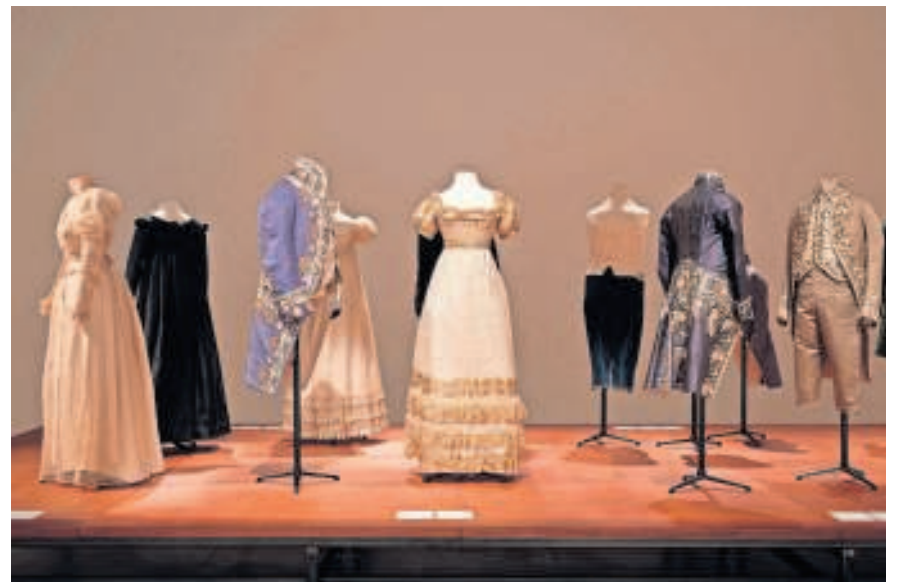
▲ Een deel van de garderobe van de Arenbergs, circa 1800.