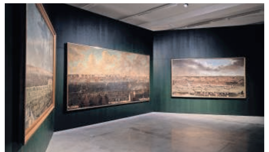
▲ Drie werken van Jan-Baptist Bonnecroy: 'De rede van Antwerpen', 'Het havenfront van Amsterdam' en 'Gezicht op Brussel'.